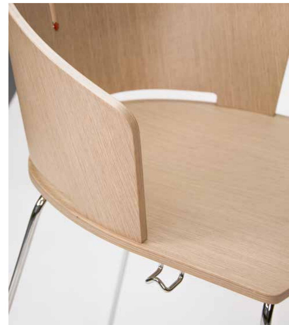
Particolare gancio appendi-borse Particular hanging-bags hook Particulier crochet accroche-sacs

Voici la deuxième version des tabourets prima , réglables en hauteur, par vérin à gaz, d'un minimum de 58,5 à un maximum de 85 cm. Le tabouret est à assise tournante, ce qui permet de faciliter son utilisation et de mieux l'exploiter